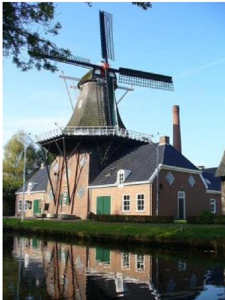
DE Wachter, Zuidlaren

Het is gebleken dat door onze aanwezigheid als amateurs ook interesse voor onze hobby wordt gewekt en dat is nog steeds noodzakelijk.